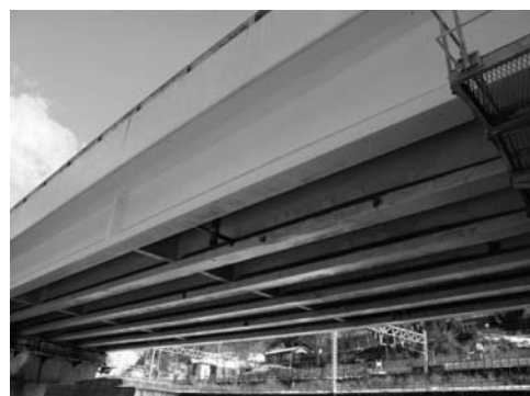
写真—2 PC 橋の塩害再劣化