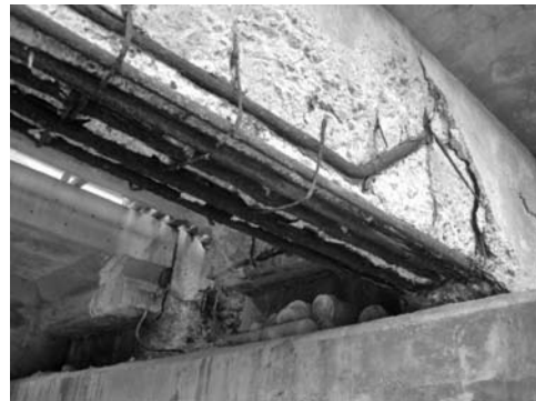
写真—1 RC 橋の塩害劣化

写真—1 に RC 橋の劣化状況を示す。この橋は、鉄筋の腐食によりかぶりコンクリートがほとんど剥落するなど、塩害による劣化が顕著な橋であった。この橋は調査後に架け替えが行われ、現在は新しい橋になっている。写真—2 は PC 橋の例である。この橋は塩害対策として表面被覆工が実施されているが、コンクリート中の内在塩分が十分に除去されていなかったことから、再劣化が生じ、表面被覆材ごと剥落を生じている。この 2 橋は海岸に近いところに建設されていることから、飛来塩分を主要因とした劣化である。写真—3 は山間部に施工された橋梁のジョイント部からの漏水に伴う桁端部の塩害劣化状況である。この塩害は凍結防止剤の散布による塩分の供給とジョイント部の止水構造が破損したことにより、桁端部を劣化させてしまった事例である。このような現地調査を踏まえて、今後どのような技術が、その橋に定期的な対策となりうるのか、橋の構造や供用環境、アセットマネジメント等を考慮しながら、塩害対策技術の研究を