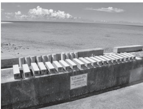
写真一八 曝露試験状況

現在、CMIは東海大学と共同研究を実施し、亜熱帯海洋環境下における鉄筋コンクリートの塩害対策についての検討も行っている。試験体の曝露場所は、沖縄県の西表島にある東海大学沖縄地域研究センター内の栈橋である。この曝露場所に、ステンレス等の各種鉄筋を埋設した試験体を曝露し、腐食の進展状況に関する研究を行っている（写真一八）。