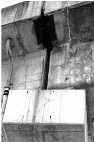
写真-3 ジョイントからの漏水による塩害