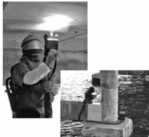
写真-5 亜鉛溶射の施工状況

電気防食は、近年日本においても適用事例が増加している。Overseas highwayでは1989年に初めて犠牲陽極タイプの電気防食が実施されている。ところがフロリダ半島は熱帯性気候という極端な環境条件のため電気防食の効果は通常の5年～8年ほど短いという結果が得られたことが報告されている。このことから、電気防食適用時の寿命設計をどうすべきか等の研究が実施されていた。また、各種電気防食工法の中で最も着目されていたのは亜鉛メッキ溶射工法であった（写真-5, 6）。この工法は、塗装と同じような考え方で、亜鉛メッキが傷んだら、再度亜鉛溶射を実施して対応しやすいなどの理由から適用される例が多いとのことであった。