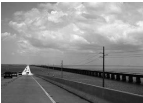
写真-4 Seven Mile Bridge

電気防食は、近年日本においても適用事例が増加している。Overseas highwayでは1989年に初めて犠牲陽極タイプの電気防食が実施されている。ところがフロリダ半島は熱帯性気候という極端な環境条件のため電気防食の効果は通常の5年～8年ほど短いという結果が得られたことが報告されている。このことから、電気防食適用時の寿命設計をどうすべきか等の研究が実施されていた。また、各種電気防食工法の中で最も着目されていたのは亜鉛メッキ溶射工法であった（写真-5, 6）。この工法は、塗装と同じような考え方で、亜鉛メッキが傷んだら、再度亜鉛溶射を実施して対応しやすいなどの理由から適用される例が多いとのことであった。