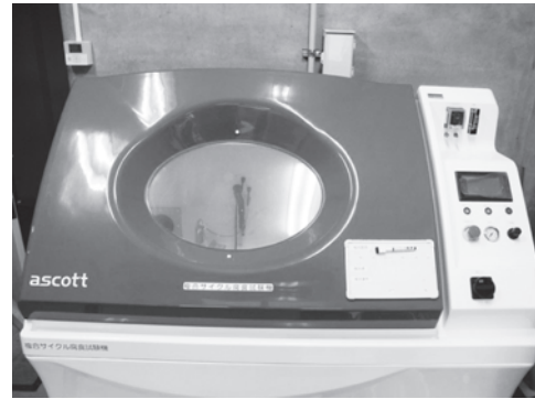
写真一九 複合サイクル試験機

また、CMI所内には複合サイクル試験機などの試験装置を導入し、促進試験で各材料の性能を検討する