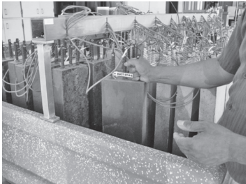
写真一七 試験状況

CMIでは、国内はもちろんのこと、海外の研究者との交流の継続により、経済的で効果的な技術や材料の開発、適用に貢献したいと考えている。