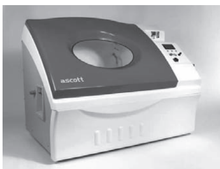
写真—2 複合サイクル試験機

複合サイクル試験機の外観を写真—2に示す。試験機の仕様は表—2のとおりであり、表中の3つの異なる環境で試験することが可能である。また、重量架台を組み合わせることにより、重量物（約100 kg）の耐塩害性の評価も可能である。