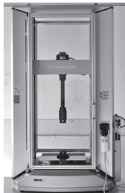
写真-1 精密万能試験機

本試験機は、変位および荷重により制御し引張試験、圧縮試験、曲げ試験、せん断試験などを実施することが可能である。精密試験機の外観を写真-1に示す。試験機の仕様は表-1のとおりである。