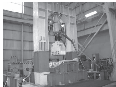
写真—6 200 kN 疲労試験機

この疲労試験機は、移設が可能な汎用、多目的の試験装置である。これまでの試験事例としては、曲げ疲労治具を組合わせて行った橋梁用ケーブルの曲げ疲労試験や、吹付けコンクリートの振動下での施工実験、橋梁に付設される照明柱等の各種付属物の疲労試験等がある。200 kN および 100 kN 疲労試験機それぞれの外観を写真—6, 7に示す。試験機の仕様は表—6, 7のとおりである。