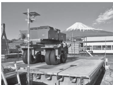
写真一八 屋外輪荷重疲労試験機 &lt;1号機&gt;

試験機の外観を写真一八、九に示す。各試験機の仕様は表一八、九のとおりである。最近、新設した2号機は載荷荷重を下げ、移動速度を速めたもので、両機とも数ヶ月に及ぶ昼夜間連続の自動運転が可能という特徴を有する。