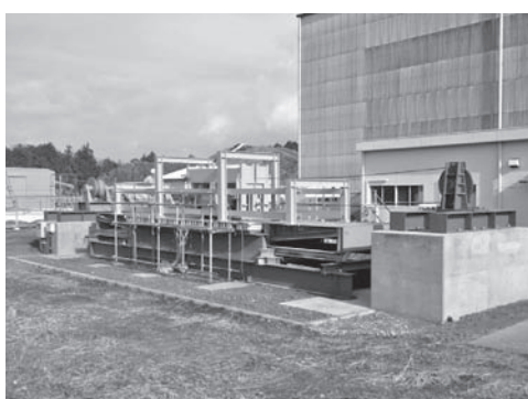
写真一九 屋外輪荷重疲労試験機 &lt;2号機&gt;