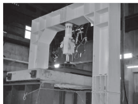
写真—7 100 kN 疲労試験機