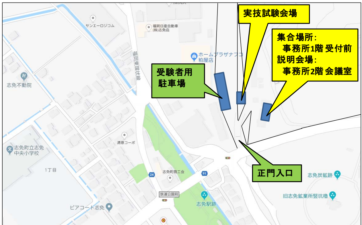
図 2 (3) 福岡会場